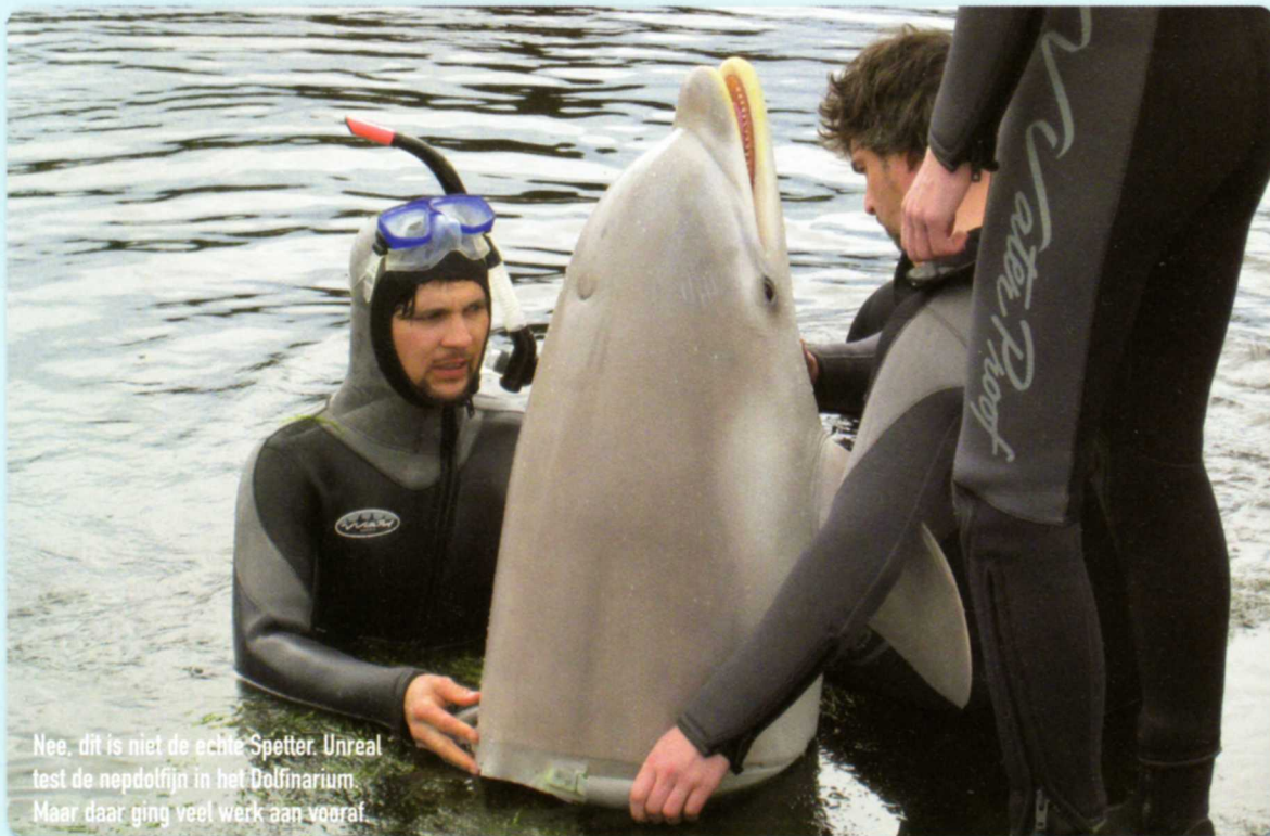
Nee, dit is niet de echte Spetter. Unreal test de nepdolfijn in het Dolfinarium. Maar daar ging veel werk aan vooraf.

Ken je hem nog, tuimelaar Spetter? De dolfijn beleefde vorige zomer op televisie spannende avonturen. Dit jaar krijgt Spettters twee dubbelgangers die alle moeilijke kunstjes doen. Lees hier hoe deze rubberen dolfijnen werden gemaakt.