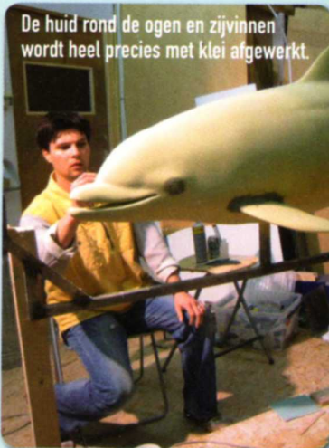
De huid rond de ogen en zijvinnen wordt heel precies met klei afgewerkt.