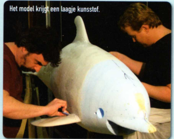
Het model krijgt een laagje kunststof.