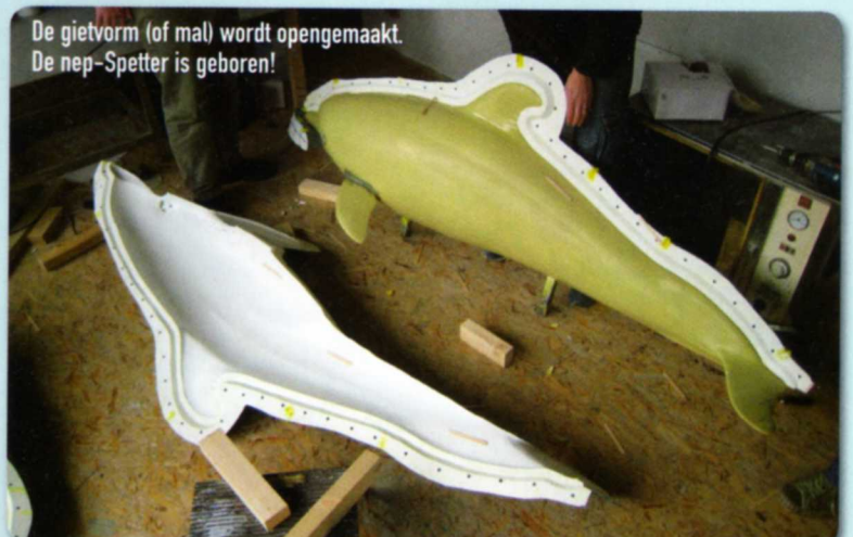
De gietvorm (of mal) wordt opengemaakt. De nep-Spetter is geboren!