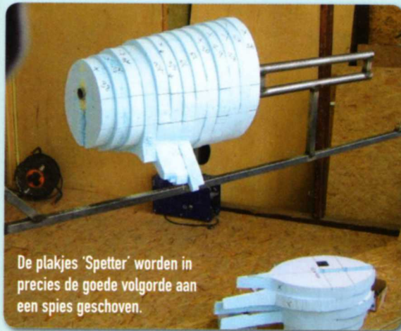
De plakjes 'Spetter' worden in precies de goede volgorde aan een spies geschoven.